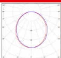
С - Прозрачный 75%

*Световой поток после рассеивателя при температуре окружающей среды 25° С