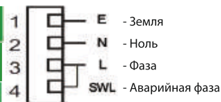
Режим постоянного действия